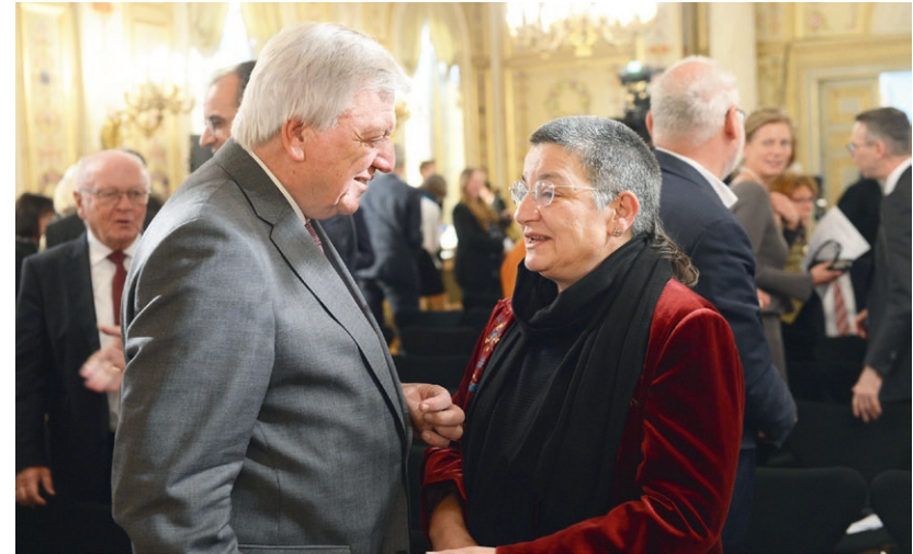
Preisträgerin Prof. Dr. Dr. h. c. Şebnem Korur Fincancı im Gespräch mit Ministerpräsident Volker Bouffier