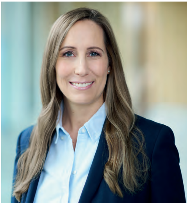
Astrid Wallmann Präsidentin des Hessischen Landtages