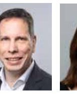
Torsten Leveringhaus BÜNDNIS 90/ DIE GRÜNEN