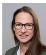
Katrin Schleenbecker BÜNDNIS 90/ DIE GRÜNEN