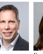
Torsten Leveringhaus BÜNDNIS 90/ DIE GRÜNEN