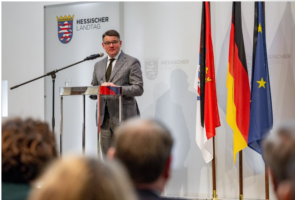
Boris Rhein, Hessischer Ministerpräsident, bei seinem Grußwort

Boris Rhein, Hessischer Ministerpräsident