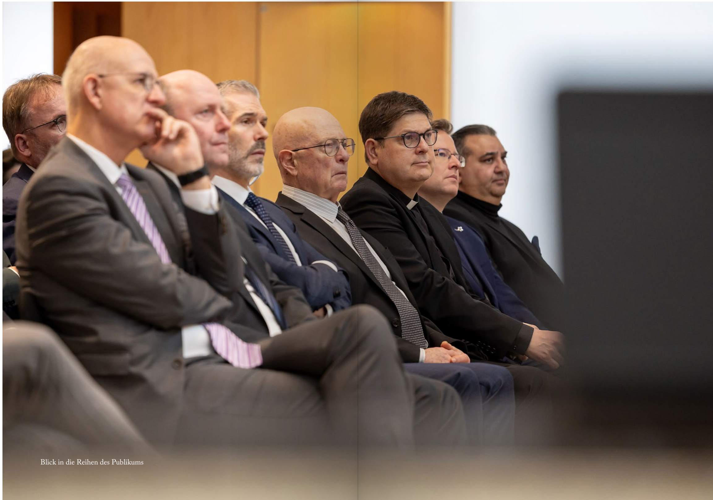
Blick in die Reihen des Publikums