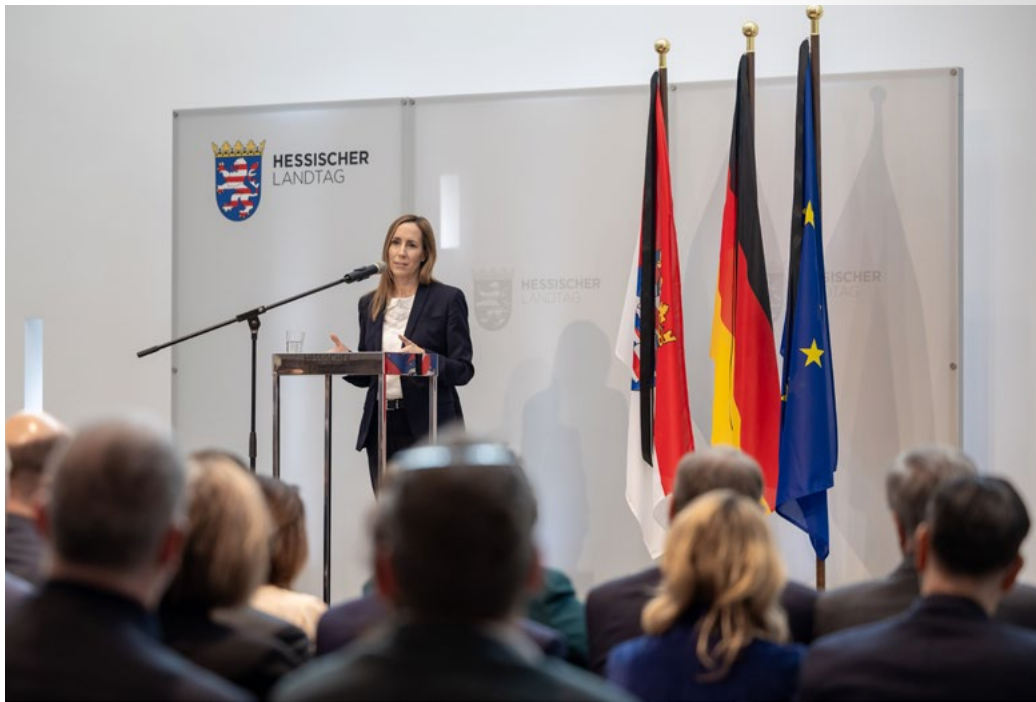
Astrid Wallmann, Präsidentin des Hessischen Landtages, bei der Begrüßungsansprache

Astrid Wallmann, Präsidentin des Hessischen Landtages