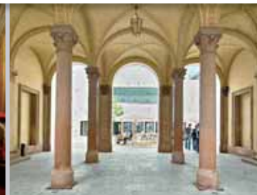
Blick in den Hof